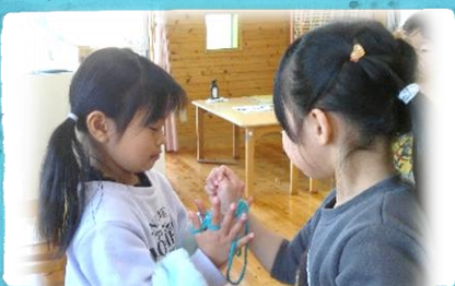
あやとりマジック