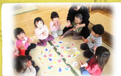
おーちたおちた なーにがおちた