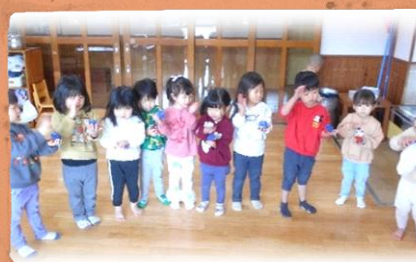
うたに合わせてタンタン