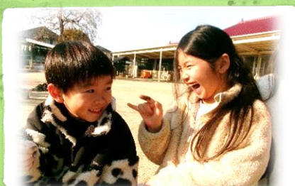
元気に過ごせますように