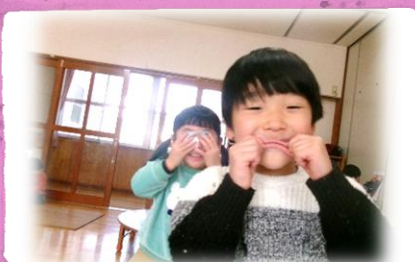
福笑いになっちゃった~