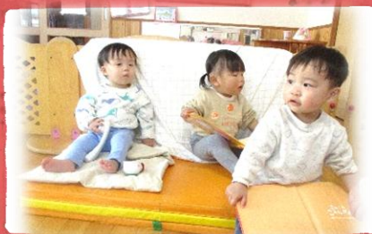
ソファでまったり♪