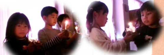
そら組によるキャンドルサービス