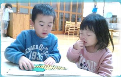
小さなぞろ組先生による 絵本の読み聞かせ