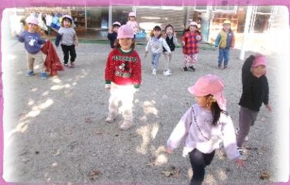
だるまさんが転んだ!