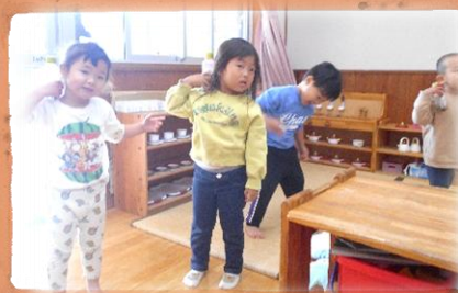
バランス バランス