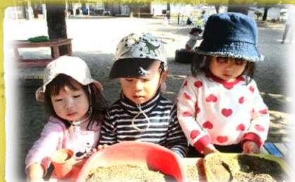
パーティーの準備、急がなきゃ!