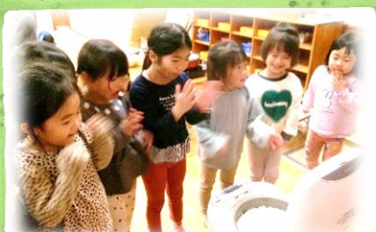
炊き立てご飯に感動