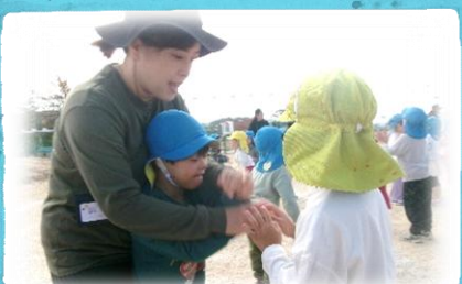
幼保交流で一緒にダンスしたよ