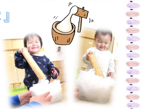
はな組はもちつきごっこを楽しみました。

デモンストレーションで大人がついている時から「よいしょ！」と元気いっぱい声を出していたこどもたち。ゆき・にじ・つき組はうさぎ杵を使って、ほし・そら組は杵を使ってつきました。つきだてのお餅はきなこや砂糖醤油をつけたり、丸めたあんこを包んだりして味わいました。餅つきサポーターの方ご参加ありがとうございました。