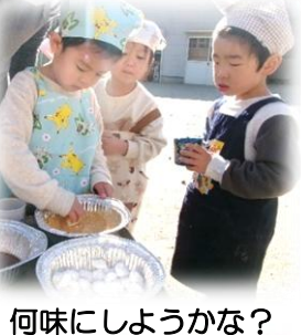
何味にしようかな？