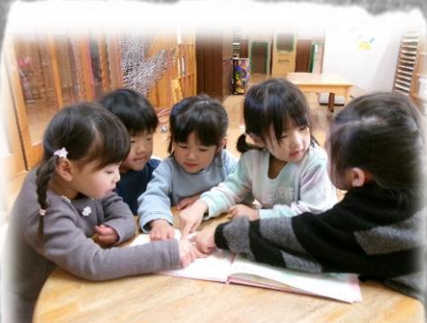
新しい絵本が届いたよ！