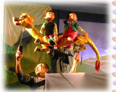
『マーリャンとまほうのふで』

劇団すぎのこによる『おおきなかぶ』と『マーリャンとまほうのふで』の観劇をしました。馴染みのある『おおきなかぶ』では自然と「うんとこしょ、どっこいしょ！」と一緒に声を出し、『マーリャンとまほうのふで』では、登場する人形に釘付けになり、前のめりで見入っていました。本物（プロ）をしっかりと目や耳で感じていた子どもたちです。