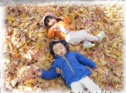
はっぱの布団、気持ちいい