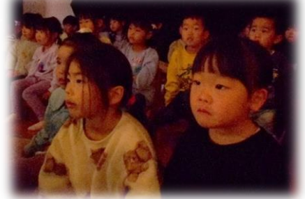
何が出てくるかな？