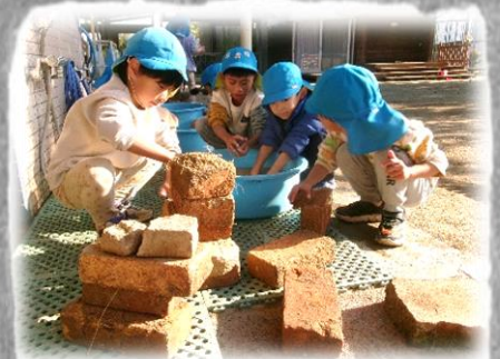
発掘したレンガ綺麗になあれ