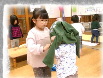
さりげなく お手伝い