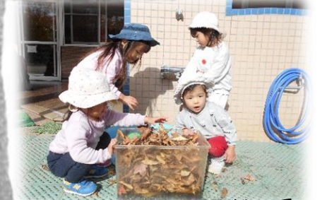
カメって冬眠するんだってー