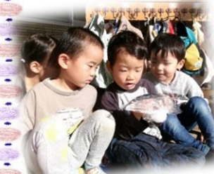
見て、触れて、さんま観察中！