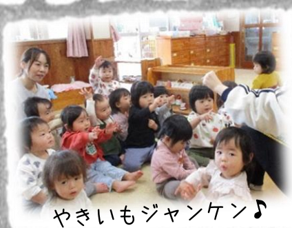
やきいもジャンケン♪