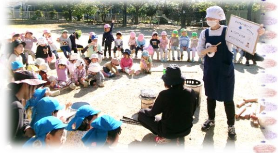
さんまクイズわかるかな？