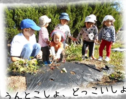
うんとこしょ、どっこいしょ