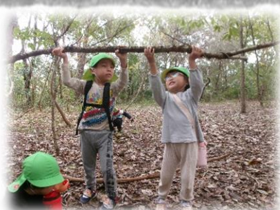
秘密基地作り開始！