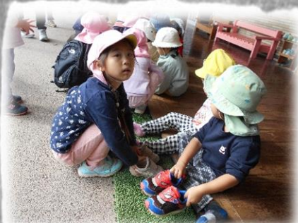
お兄さん・お姉さんよ！