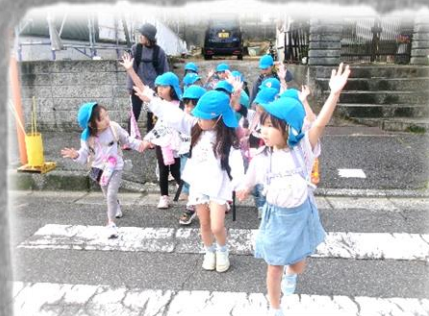
自分の目で安全確認👁️