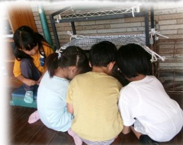
そらさんがいない間は、 僕たちがみんなのために