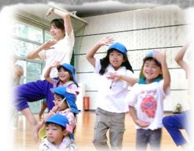
そらキャンプで新たな踊り しえ—————！