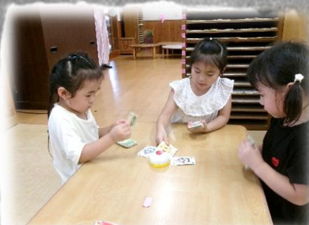
カードゲームに夢中！